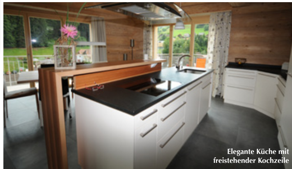
Elegante Küche mit freistehender Kochzeile

der teilüberdachten Terrasse in eine Diele mit Gäste-WC. Eine Schichtholzplatte mit einem ausgefrästen Tannenwaldmotiv bekleidet die Tür. Die liebevolle Gestaltung hat Ruedi Locher mit dem ortsansässigen Schreinerbetrieb Iseli ausgearbeitet, der auch den weiteren Ausbau des Gebäudes tatkräftig unterstützte.