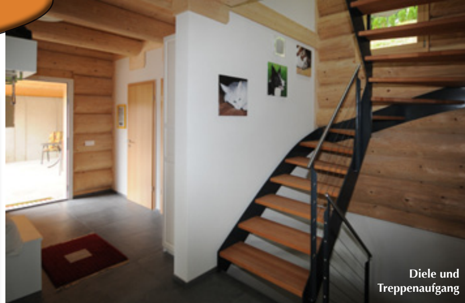
Diele und Treppenaufgang