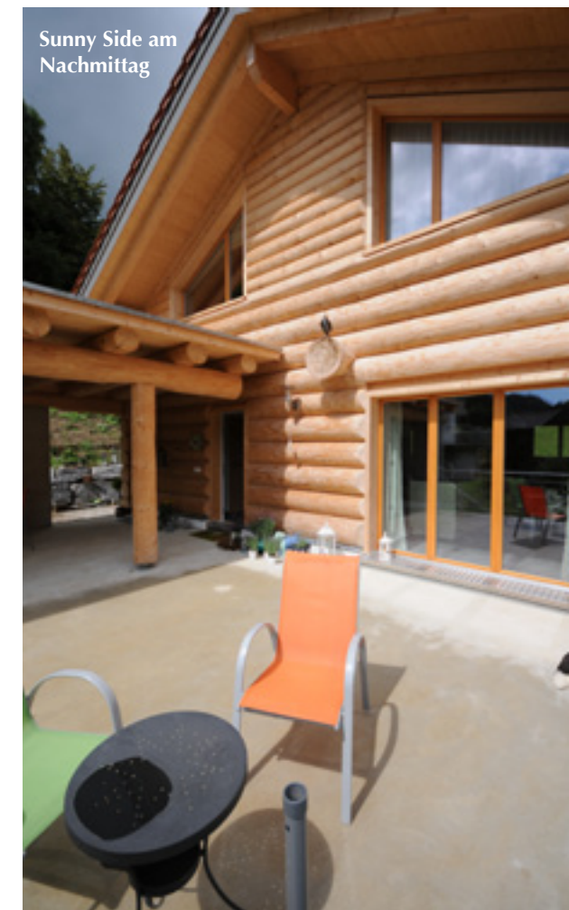
Sunny Side am Nachmittag

Hanges mit einer doppelt verlegten Steinmauer bietet einen wesentlichen sicheren Halt als eine Betonspundwand, da sie das Hangwasser entweichen lässt, so dass sich kein Druck aufbaut“, erklärte der erfahrene Bergbauer. Oben auf der Hangterrasse vor dem Haus gestaltet seine Frau einen bunten, liebevollen Garten.