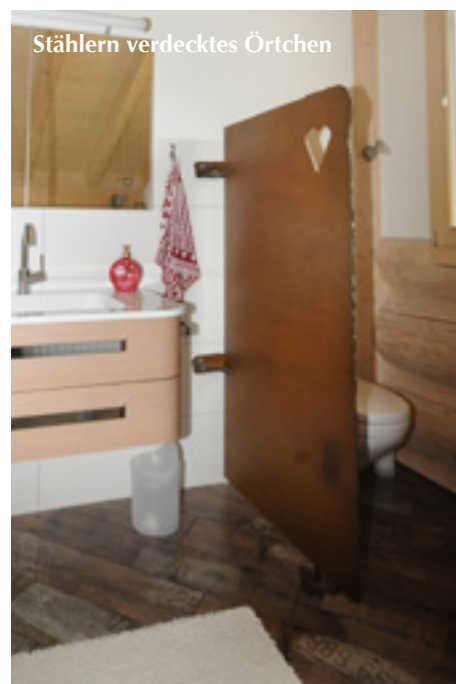
Stählern verdecktes Örtchen