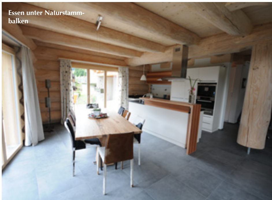
Essen unter Naturstambalken

Stolz präsentiert Ruedi Locher ein weiteres Kreativ-Highlight. Aus einer dicken Stahlplatte mit künstlich angerosteter Oberfläche hat er sich einen WC-Sichtschutz anfertigen lassen. Die klar lackierte rostbraune Trennwand ist äußerst robust und harmoniert mit der Einrichtung.