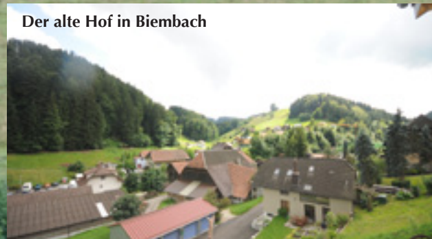
Der alte Hof in Biembach