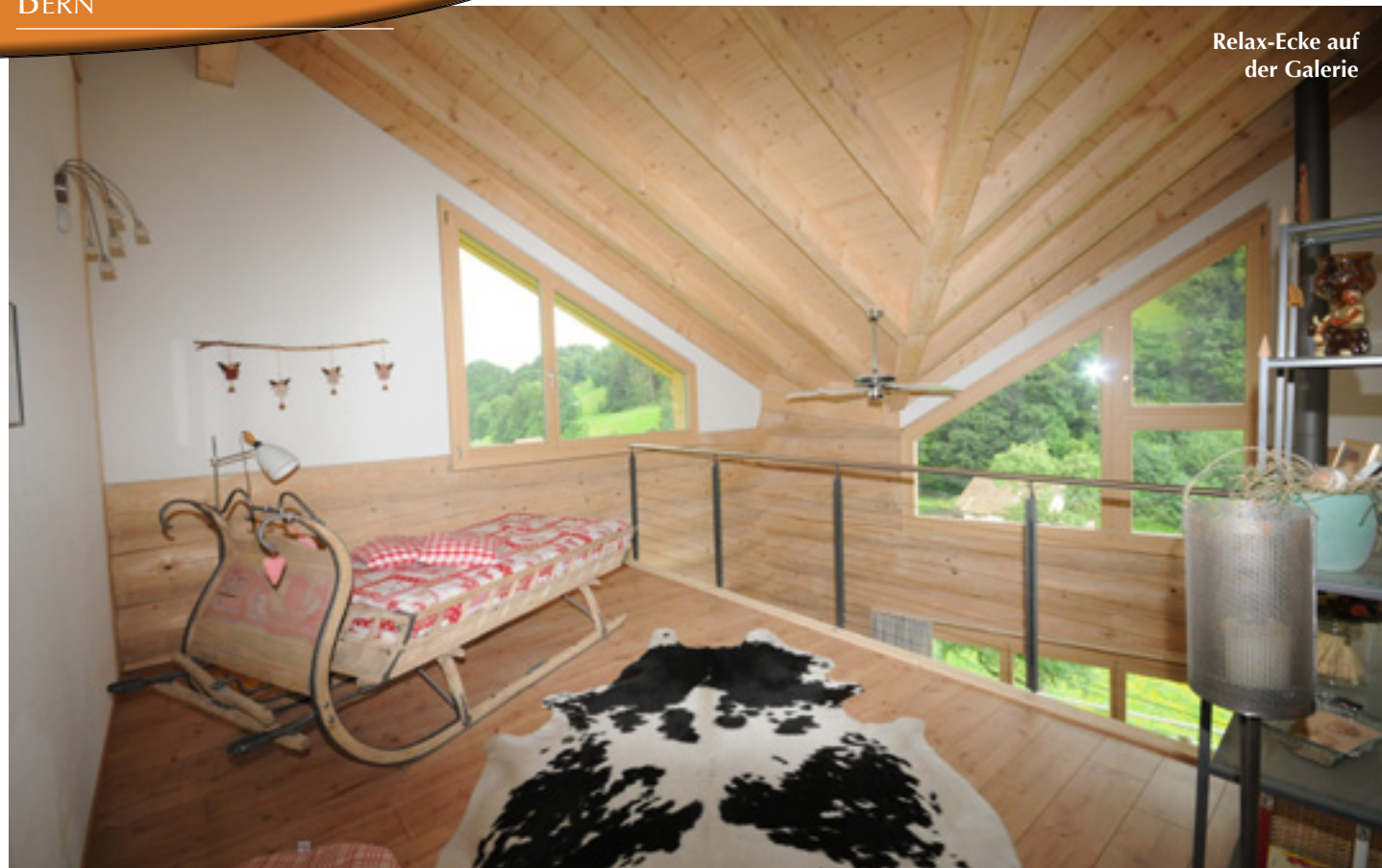
Relax-Ecke auf der Galerie