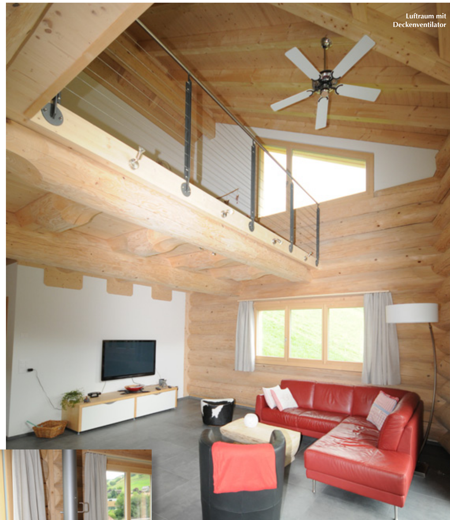
Luftraum mit Deckenventilator