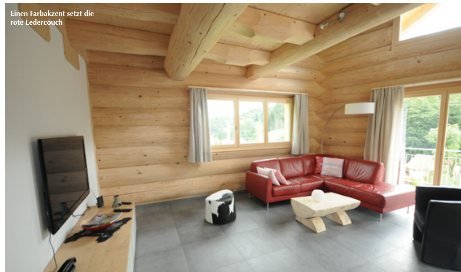
Einen Farbakzent setzt die rote Ledercouch

Hanges mit einer doppelt verlegten Steinmauer bietet einen wesentlichen sicheren Halt als eine Betonspundwand, da sie das Hangwasser entweichen lässt, so dass sich kein Druck aufbaut“, erklärte der erfahrene Bergbauer. Oben auf der Hangterrasse vor dem Haus gestaltet seine Frau einen bunten, liebevollen Garten.