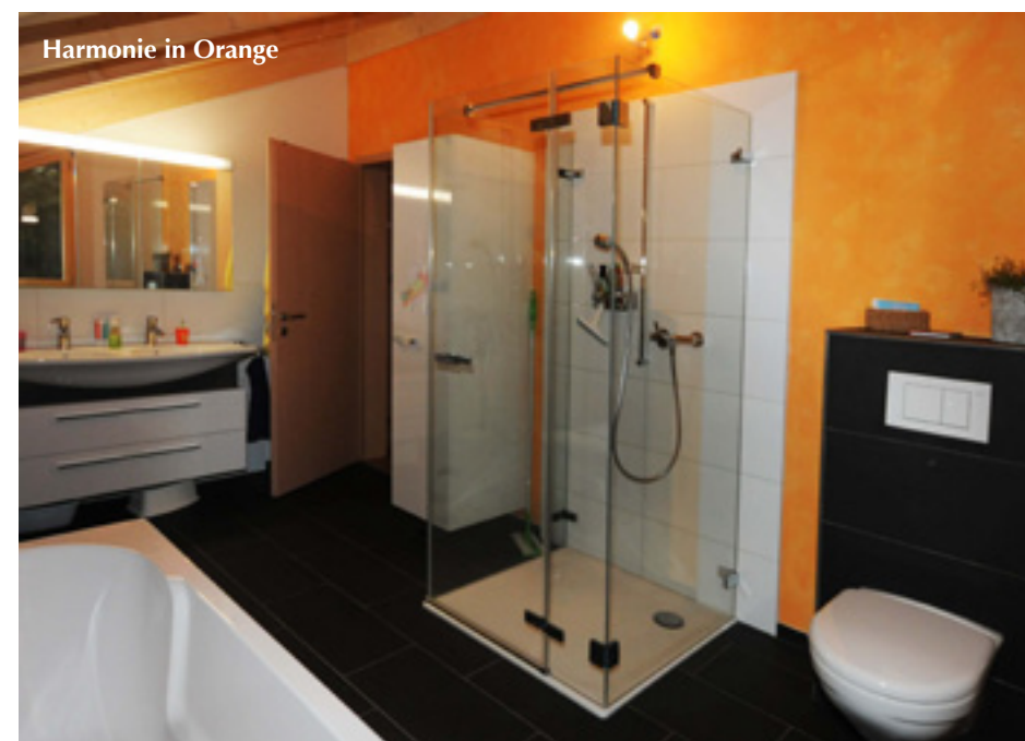
Harmonie in Orange