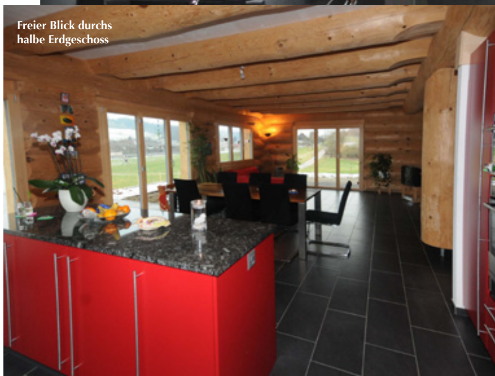
Freier Blick durchs halbe Erdgeschoss

Viertelstunde entfernt von Safenwil seine Produktionsstätte hat. Über 50 Referenzhäuser mit moderner Gestaltung, perfekter Konstruktion und edlem Innenausbau kann dieser allein in der Schweiz vorweisen. Das sagte dem Paar so zu, dass sie sich statt des Kaufs eines Altbau Eigentums nun zum Bau eines 'Kanadiers' entschlossen. Die geringe Entfernung zum Betrieb hatte viele Vorzüge. Die Bauherren waren begeistert, dass sie unter der Woche schnell mal einen Blick auf das werdende Haus werfen konnten, das in einer sauberen Halle Stammlage um Lage heranwuchs.