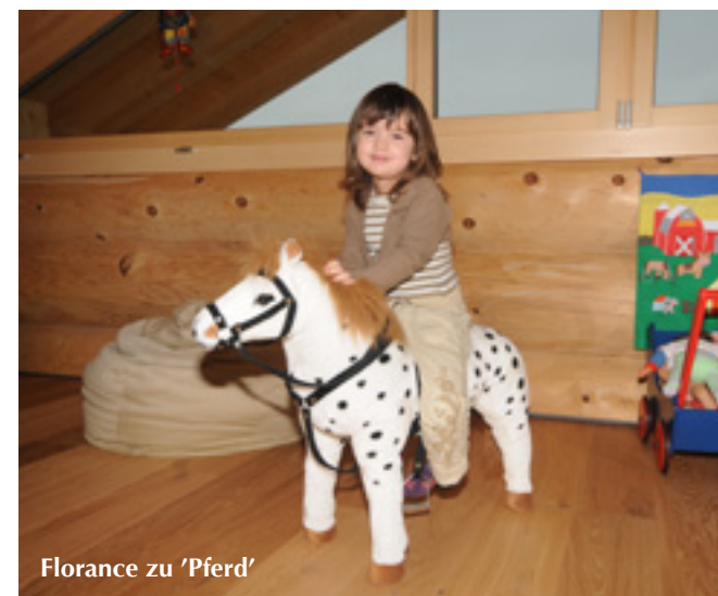
Florance zu 'Pferd'

Alle Zimmer im Obergeschoss sind über dreieckige Giebelverglasungen bestens ausgeleuchtet. Zusätzlich transportieren weißen Leichtbauwände das Licht ins Geschossinnere. Mollig warm sind die Eichenholzböden. Und der drei Stamm-