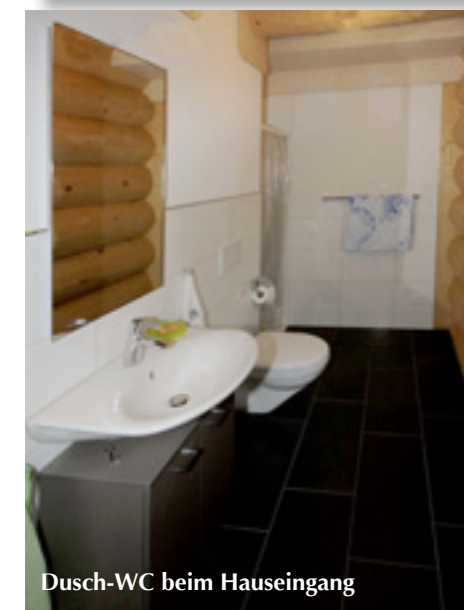
Dusch-WC beim Hauseingang

bedeutende Tal ist eine der Hauptverkehrsachsen der Schweiz, hier passiert man zwischen Bern, Basel und Zürich. Seit dem 18. Jahrhundert führt eine Eisenbahntrasse hindurch und seit 1967 quert die Autobahn das walddreiche und landwirtschaftliche genutzte Gebiet. Andererseits hat dieser Umstand natürlich den Vorteil, dass man von hier mühelos jeden Ort der Schweiz erreicht.