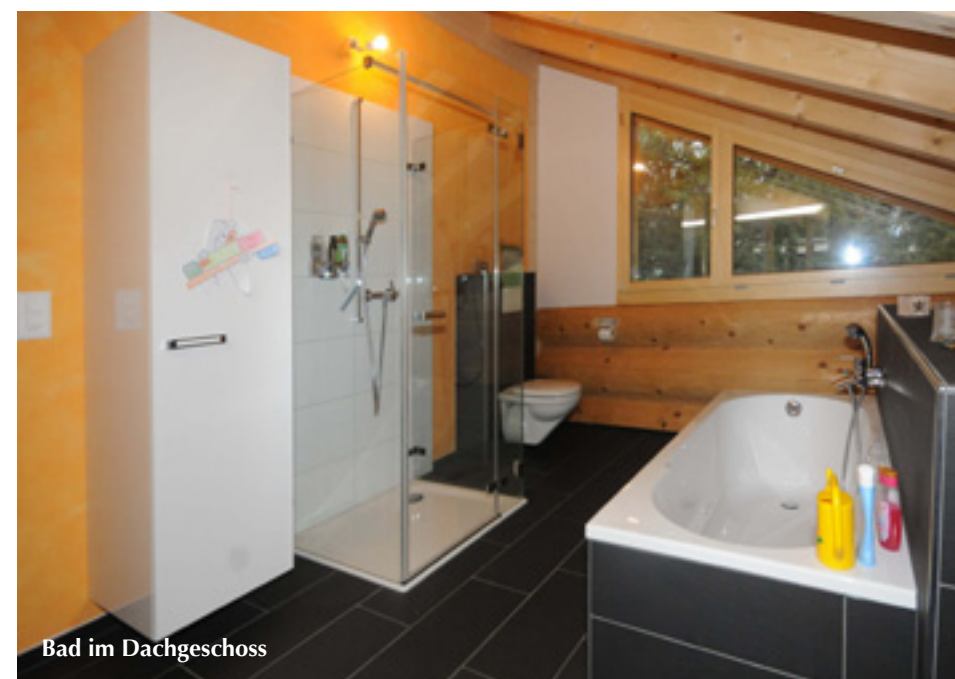
Bad im Dachgeschoss