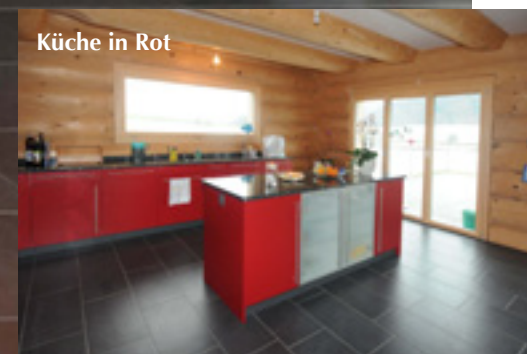
Küche in Rot