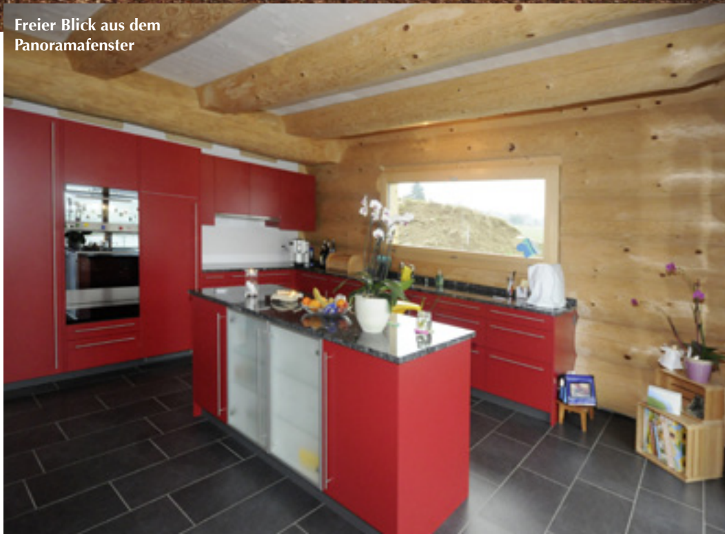
Freier Blick aus dem Panoramafenster

Das schöne Muldental um Safenwil in einer sanften Hügellandschaft mit einer Höhe von 300 bis über 600 Metern hat reichlich Baugrundstücke, aber auch etwas Bedenkliches. Das schon zur Römerzeit