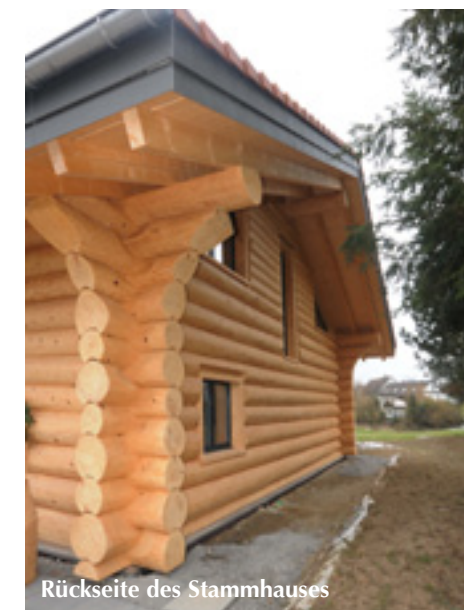
Rückseite des Stammhauses