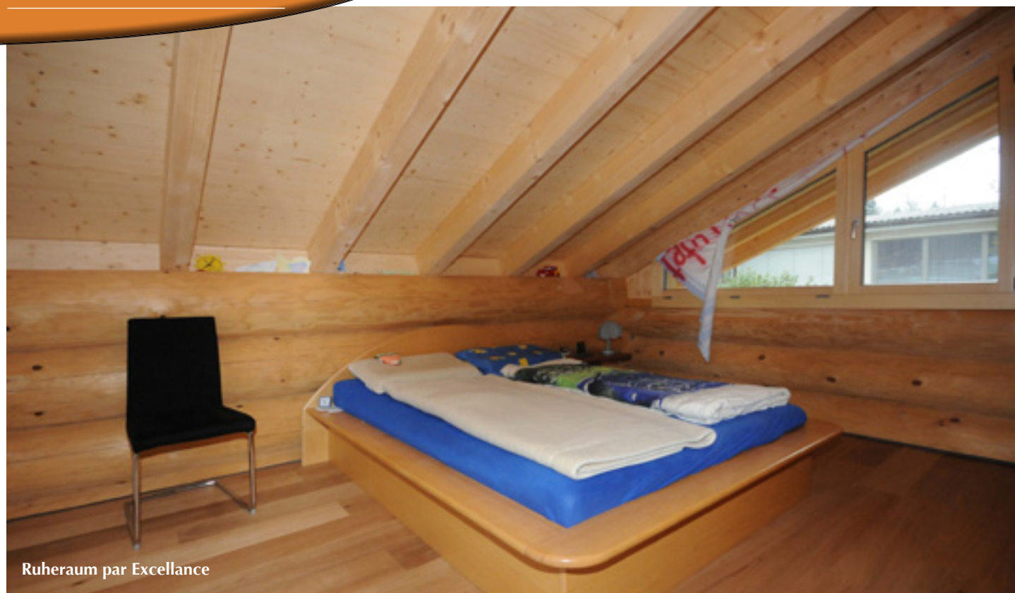
Ruheraum par Excellence

dass sich diese Problematik durch gezielte Holzwahl und fachgerechten Umgang mit dem Baustoff vermeiden lässt – und er sollte Recht behalten.