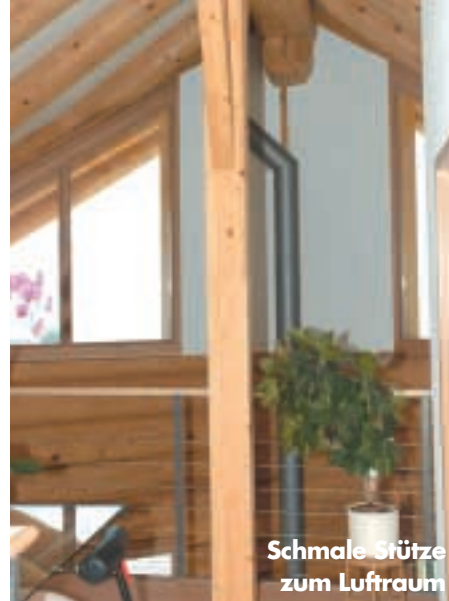
Schmale Stütze zum Luftraum

onshalle des Herstellers im Schweizer Mittelland, um den Baufortschritt zu verfolgen.