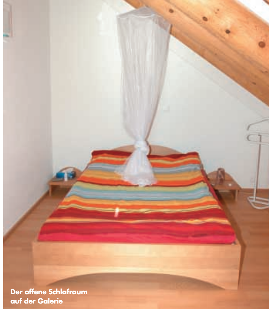
Der offene Schlafraum auf der Galerie

den Sichtsparren und im Schiffsgiebel machen das Hausinnere hell und elegant. Insbesondere die saubere Verarbeitung und Anbindung der Mauerwerkswände tragen zum modernen Ambiente bei. Nachträglich zollen die Bauleute dem Projektleiter dafür höchste Anerkennung.