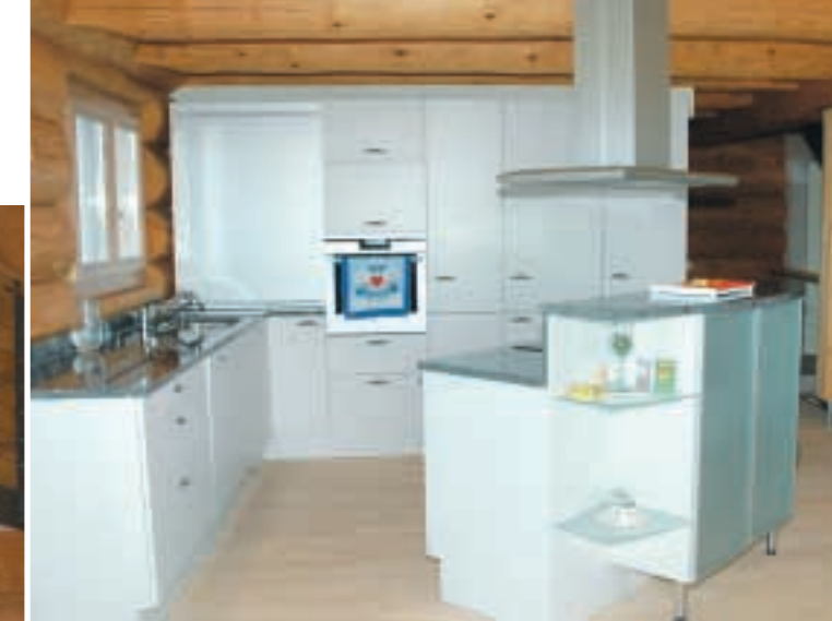
Offene Küche mit freistehendem Herd