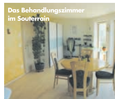
Das Behandlungszimmer im Souterrain

'Last but not least' muss die Geschäftsidee der Bauherrin erwähnt werden. Im Souterrain begrüßen bunte, mit Filz bedeckte Stammhocker Kunden, die sich für handgemischte Natur-Kosmetik interessieren oder eine Aroma-Massage-Therapie von der Spezialistin wünschen. Unter der einprägsamen Bezeichnung 'Duftlisa' werden Bach-Blüten- und Bewusstseins-Seminare, Aromakurse oder Klangtherapien angeboten. Für all diesen Service liefert das Naturstammhaus die passende 'Hülle'. Ganz neu – und ebenso passend zum Blockhaus – sind Baumduft-Kurse und die Kooperation mit 'Baumbilder', ein Fotograf, der Bilder von Gesichtern und Baumstämmen ( www.baumbilder.com ) verschmelzen lässt.