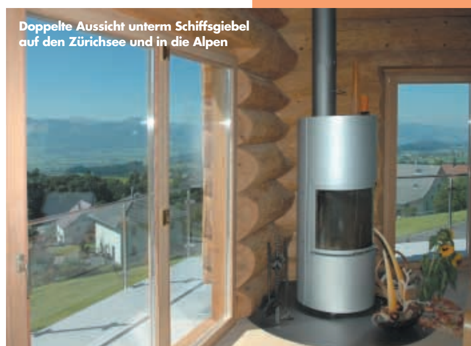
Doppelte Aussicht unterm Schiffsgiebel auf den Zürichsee und in die Alpen

Das Bauherrenpaar hatte sich schnell für einen heimischen Naturstammhaus-