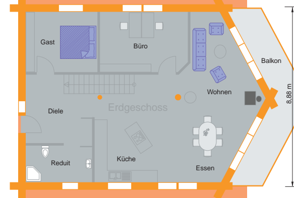
Das Weisstannenhaus bietet auf etwa 14 x 9 Meter runde 160 qm Wohnfläche zzgl. der Kellerräume