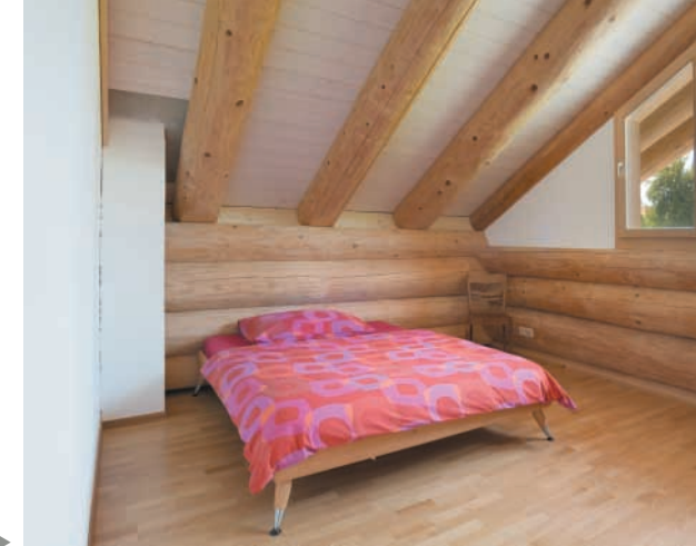
Gästezimmer unter Rundsparren