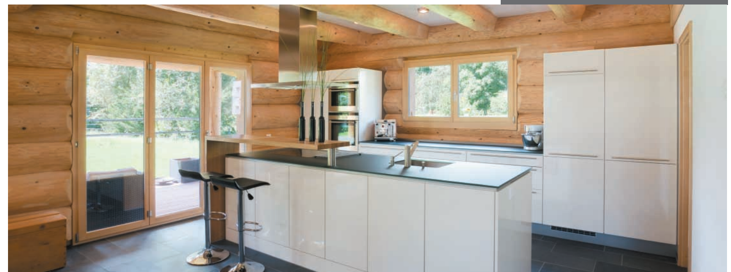
Küche mit schwenkbarer Theke