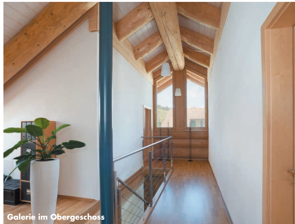
Galerie im Obergeschoss

Auf guten 155 Quadratmetern Wohnfläche befinden sich im Parterre des Hauses der offene Wohnraum mit Küche und Essbereich. Der gesamte Fußboden wurde mit einem dunkelgrauen brasilianischen Schiefer bedeckt. Eine Luftwärme-Pumpe im Keller versorgt die Fußbodenheizung im gesamten Haus. Wohl geordnet ist das moderne Mobiliar im großen Wohnraum. Breite Verkehrswege machen das Naturstammhaus angenehm zu bewohnen. Die freistehende Küchenzeile mit kleiner Theke ist ein praktischer Raumtrenner. Ein