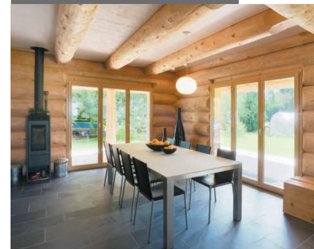
Esszimmer mit Kaminofen