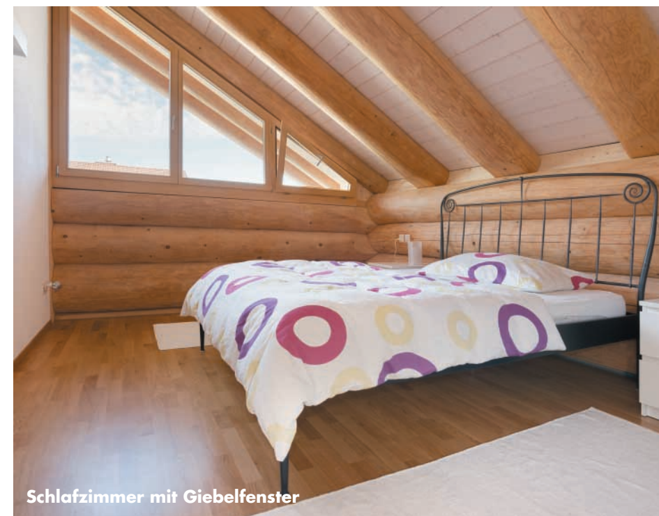
Schlafzimmer mit Giebelfenster

Alaska Blockhaus GmbH Kirchmatten 507 CH-5057 Reitnau Telefon 0041-(0)62-7268147 Internet www.alaska-blockhaus.ch