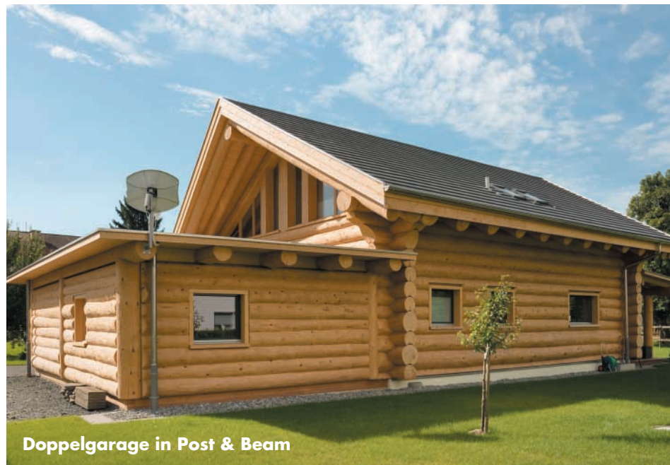
Doppelgarage in Post & Beam

Modern, offen und hell präsentiert sich ein Naturstammhaus in der Schweiz nahe des Bodensee-Südufers. Eine weitumlaufende Veranda und die Doppelgarage aus Stammfosten machen das Projekt zu einer weiteren stimmigen Referenz.