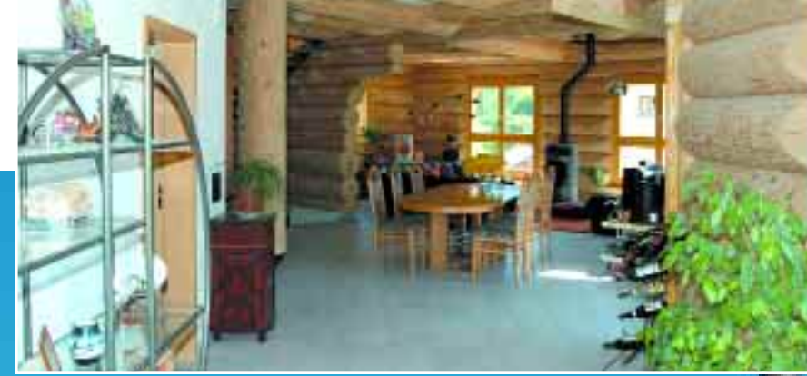
Vom Eingang blickt man weit in die Tiefe des Naturstammhauses aus Weisstanne.