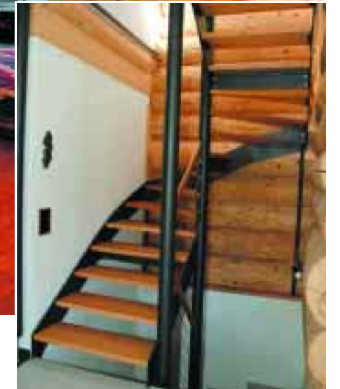
Eine Stahltreppe im Gußeisenlook sowie schlichte Treppentritte bringen Kontrast.