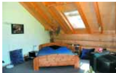
Das Schlafzimmer mit Ankleide erstreckt sich über die volle Hausbreite.

Im Obergeschoss wurde das Weisstannenhaus mit vier Stammlagen als Kniestock versehen. Mit einer Dachneigung von 30 Grad bietet es somit ausreichende Begehbarkeit im Obergeschoss. Zudem kommt der Nutzbarkeit die Aufdachdämmung zu Gute. Diese Dachkonstruktion erweitert die Kopffreiheit.