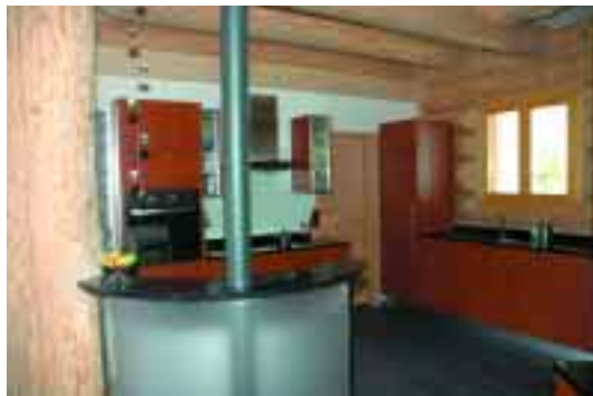
Rustikale Rundholzbauteile im modernen Küchenbereich.

Das Naturstammhaus lernten die jungen Bauherren in den USA kennen. Doch, so war ihr Plan, sollte mit heimischen Hölzern gebaut werden. Dies war ohnehin eine Grundvoraussetzung, da im ortsnahen Bergwald das Starkholz üppig vorhanden ist. Nach wenigen Gesprächen mit der Kommune zeigte diese sich sehr verständlich und veräußerte gute Stämme aus den eigenen Beständen.