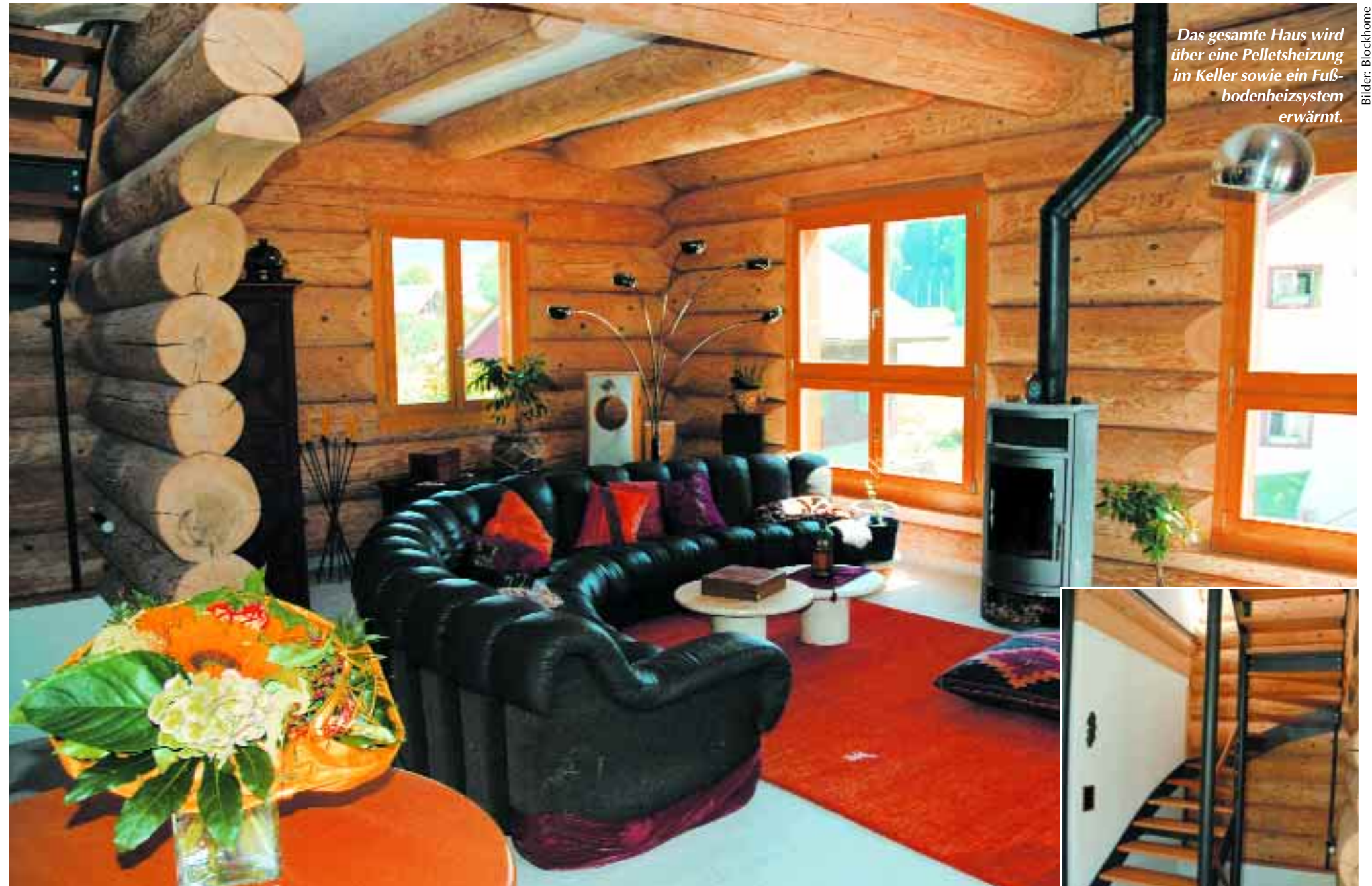
Das gesamte Haus wird über eine Pelletsheizung im Keller sowie ein Fußbodenheizsystem erwärmt.