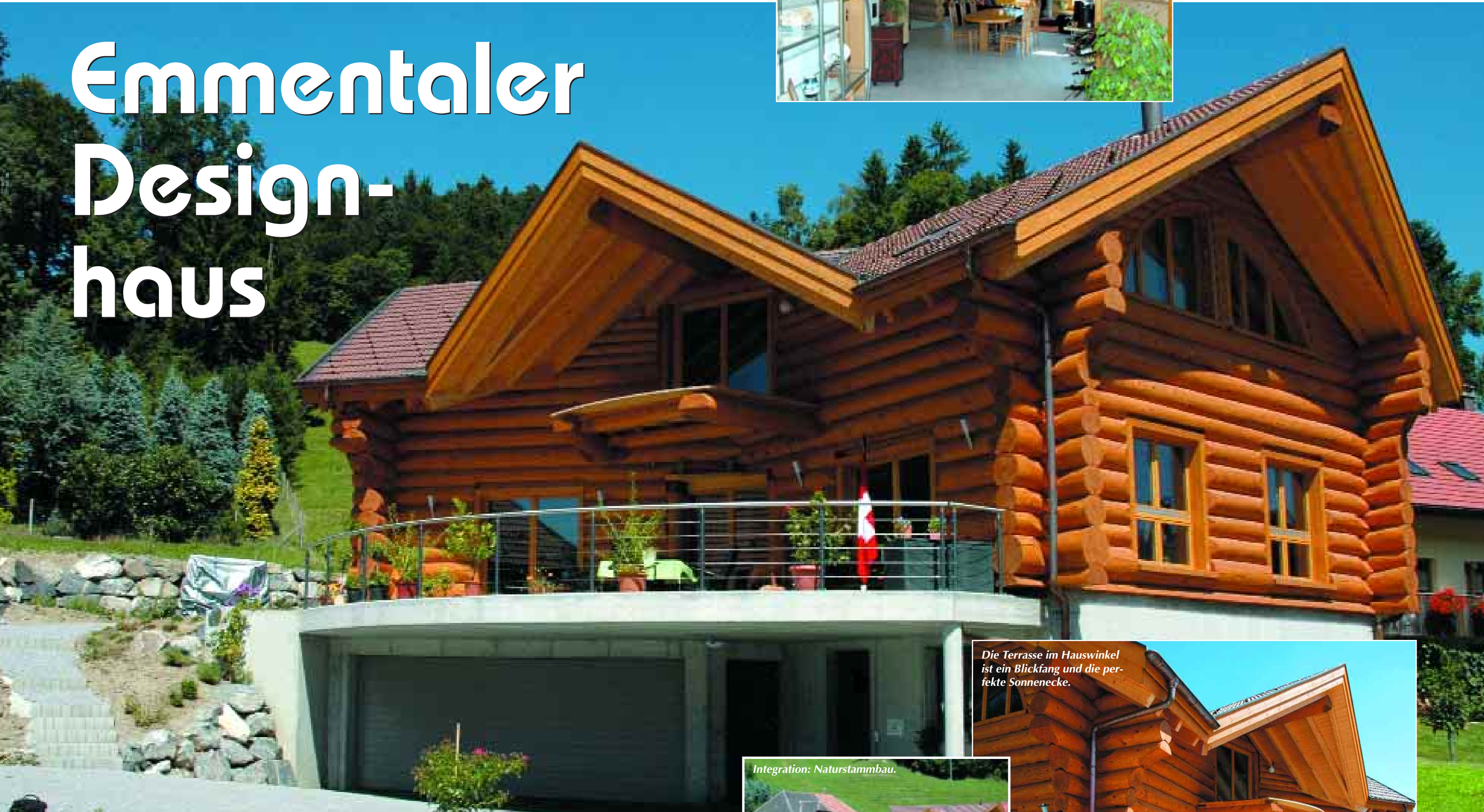
Die Terrasse im Hauswinkel ist ein Blickfang und die perfekte Sonnenecke.